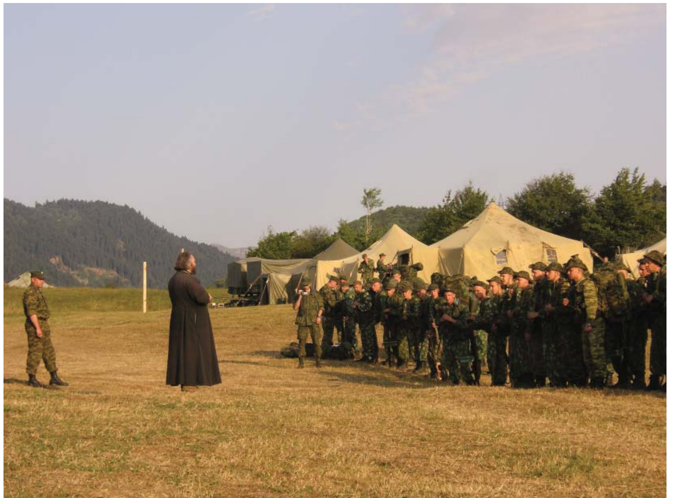
Южная Осетия, август 2008 год Благословение на выполнение боевой задачи

Отец Дмитрий также рассказал, что за время командировки Святое Крещение приняли около сорока российских военнослужащих. "За это время мы посетили много наших подразделений и не только на территории Осетии, но и в буферной зоне безопасности на территории Грузии. Мы передали нашим воинам духовную литературу, крестики, иконочки, вели беседы с военнослужащими. Встречали нас везде радушно, причем во многих подразделениях мы были не впервые, поскольку приезжали к ним ещё во время их службы в Чечне, поэтому можно сказать, что встречались со старыми друзьями. Работы непочатый край, нужда в священниках огромная, поэтому я