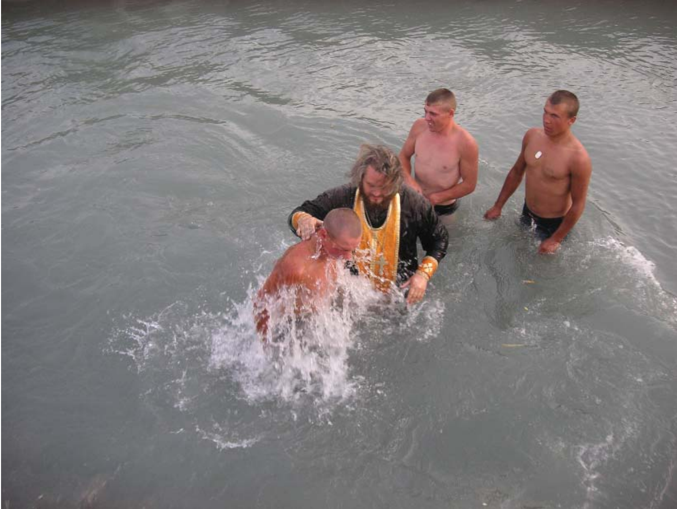
Южная Осетия, август 2008 год Крещение солдат