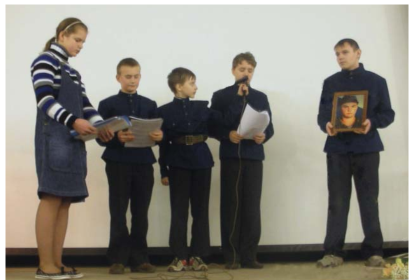
Выступление учащихся школы № 58