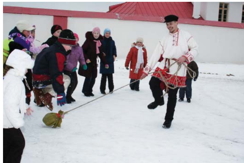
Весёлая игра «Успей подпрыгнуть»