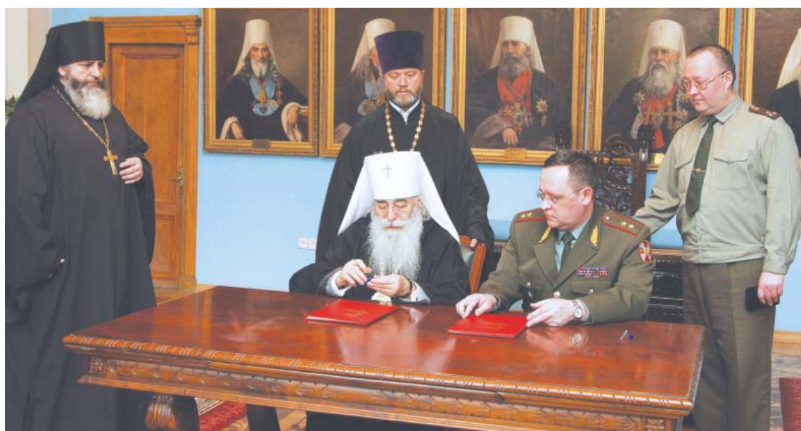
8 апреля подписано соглашение о сотрудничестве между Северо-Западным региональным командованием внутренних войск МВД РФ и Санкт-Петербургской епархией Русской Православной Церкви.

ОТДЕЛ ПО ВЗАИМОДЕЙСТВИЮ С ВООРУЖЕННЫМИ СИЛАМИ И ПРАВООХРАНИТЕЛЬНЫМИ УЧРЕЖДЕНИЯМИ