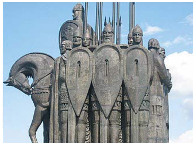
Памятник св. кн. Александру Невскому с дружиной под Псковом