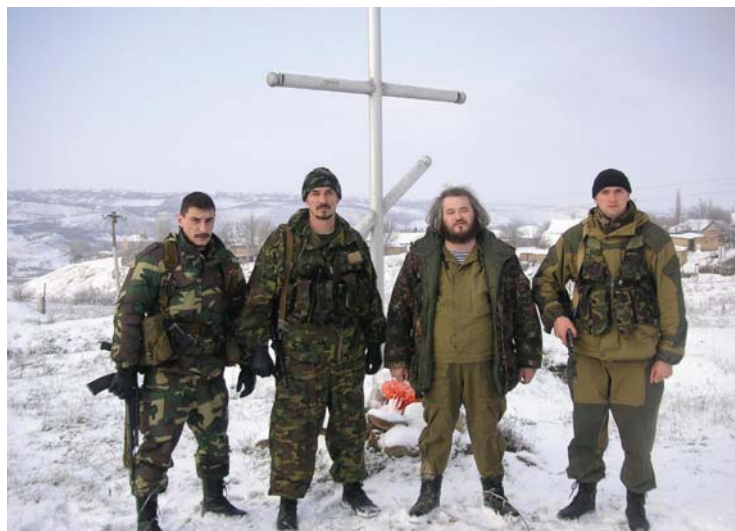
На месте гибели героев-пограничников. Дагестан