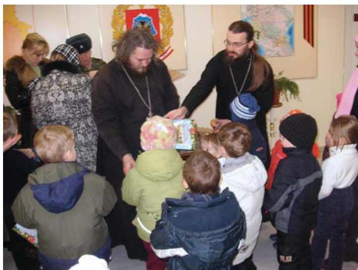
В гостях у детей военнослужащих