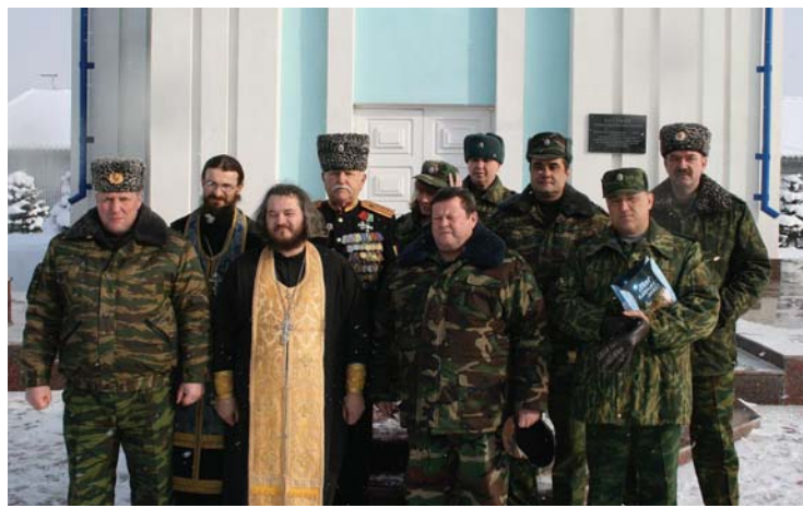
После молебна в храме-часовни ОГВС