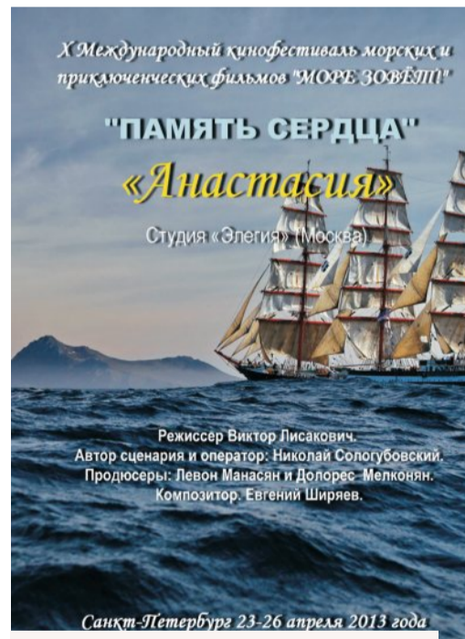
Режиссер Виктор Лисакович. Автор сценария и оператор: Николай Сологубовский. Продюсеры: Левон Манасян и Долорес Мелконян. Композитор: Евгений Ширяев.