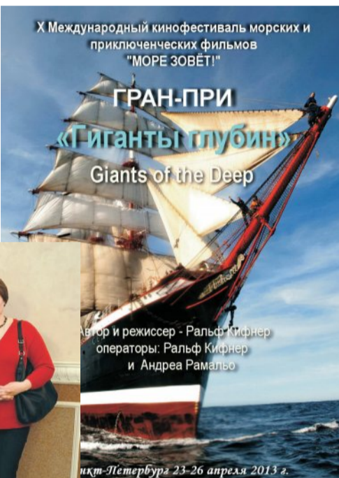
Автор и режиссер - Ральф Кифнер операторы: Ральф Кифнер и Андреа Рамальо